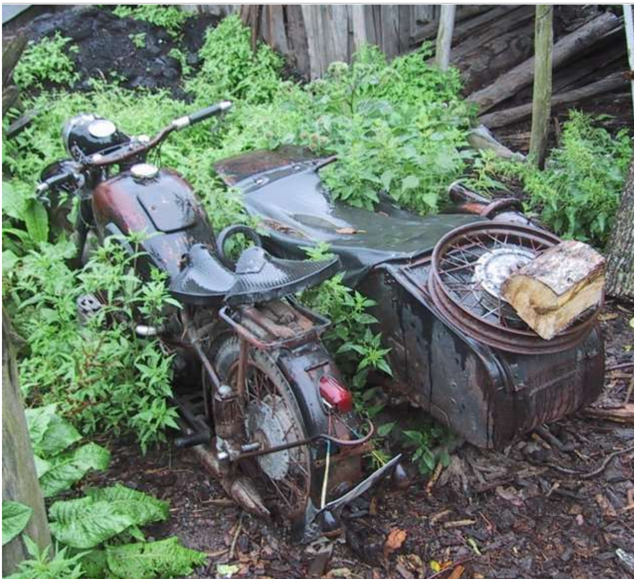
Sådan kan en M72'er se ud, når man 'falder over den' i Ukraine

Ring til Kim på dette (mobil)telefonnummer: 2728-0560.